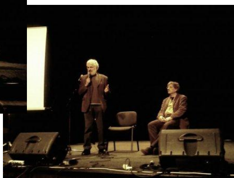
Diskusia na Koncerte pre všímavých