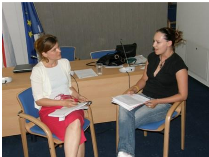
Mediálny tréning AFP pre mimovládne organizácie