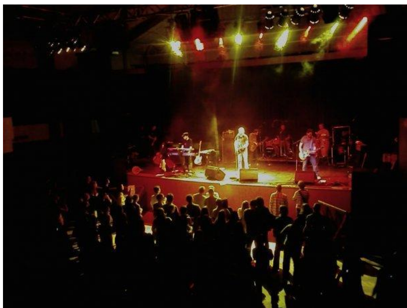
Koncert pre všímavých – 17. 11. 2008