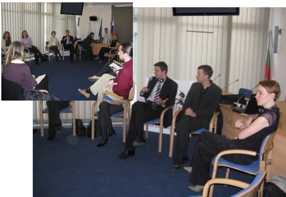
Tréning organizácie Global Witness pre slovenské mimovládky