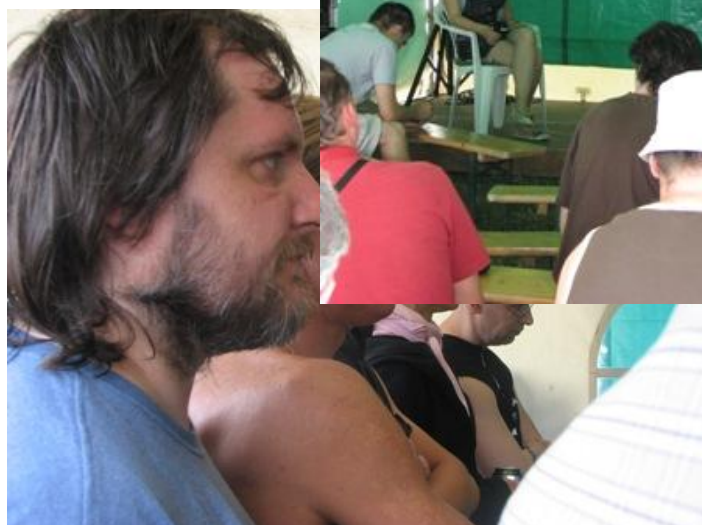
Diskusia Aliancie Fair-play na festivale Bažant Pohoda 2008